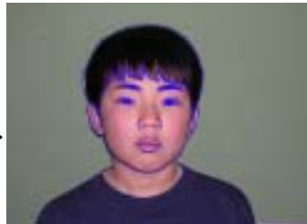
レイヤーを作ってなぞる