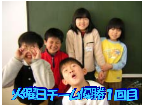
子どもたちのよろこび