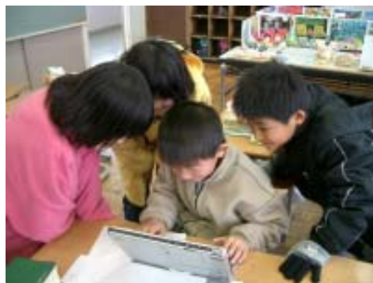
グループで声を掛け合う。