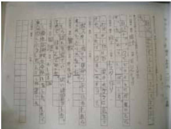
web 学級日誌専用用紙