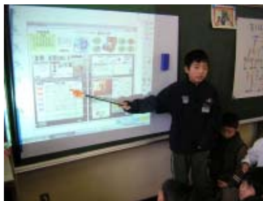
週1回 web 学級日誌コンテスト