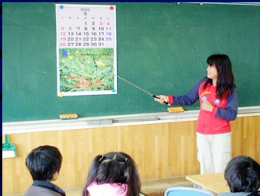
春のプレゼン大会