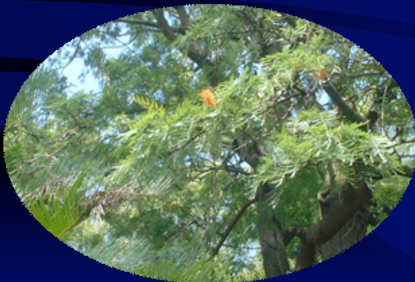
日本でただ一本だけ花をつける ハゴロモノキ