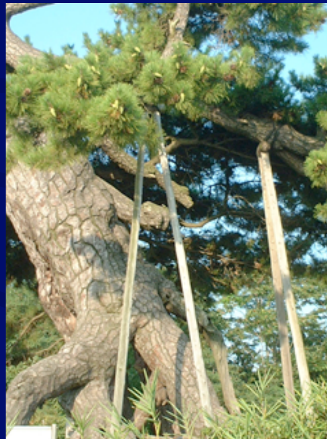
和歌山附属小のシンボル 根上がり松